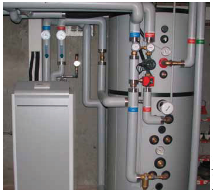
... und Wärmepumpen.